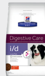
Hill's Prescription Diet i/d Low Fat

Nutriție dovedită clinic pentru a ajuta la rezolvarea diareei