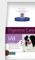
Hill's Prescription Diet i/d Sensitive

Ajută la ameliorarea tulburărilor digestive cauzate de stres la câinii de până la 14 kg