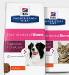
Hill's Prescription Diet Gastrointestinal Biome

Nutriție cu număr scăzut de ingrediente pentru enteropatiile cronice tratabile cu alimente