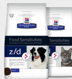
Hill's Prescription Diet z/d

S-a dovedit clinic că rezolvă diareea chiar și în primele 24 de ore și promovează scaune regulate sănătoase*