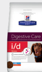
Hill's Prescription Diet i/d Stress

Nutriție dovedită clinic pentru scăderea trigliceridelor serice, un factor de risc al pancreatitei