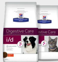
Hill's Prescription Diet i/d

Tehnologia ActivBiome+ de la Hill's, un amestec revoluționar de prebiotice, demonstrat că hrănește rapid microbiomul intestinal pentru a susține starea de bine și digestia sănătoasă.