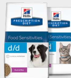
Hill's Prescription Diet d/d*

S-a dovedit clinic că îmbunătățește semnele digestive în 21 de zile